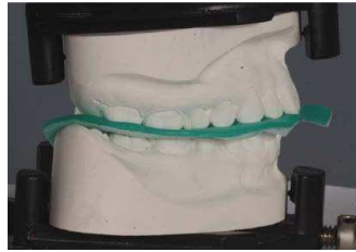
2. speedbyte Artikulator (gipslose Modellfixierung) fest schließen