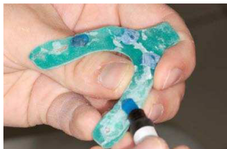
7. bei den posterioren Stopps gleichermaßen vorgehen