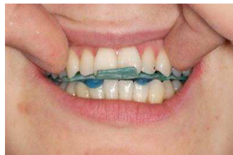
6. Patient mehrmals in Zentrik führen, dann die Stopps lichthärten