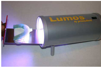
3. den so perfekt adaptierten Träger 3-6 Minuten lichthärten