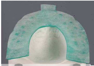
1. primobyte Registrat-Träger auf OK-Modell adaptieren