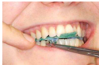
8. fertiges Registrat mit Shimstockfolie abschließend prüfen

Lichthärtende primobyte Registrat-Träger stellen durch ihre Beschaffenheit eine minimale Sperrung der Vertikalen bei der Bissregistrierung sicher, denn sie sind extrem dünn, dennoch hoch form- und dimensionsstabil. Sie sind fest und temperaturunempfindlich und bleiben lange erhalten, sodass in der Regel nur ein Registrat benötigt wird.