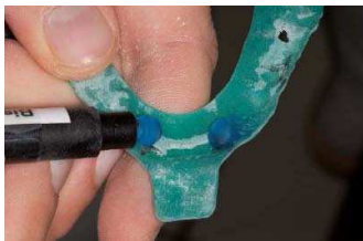
5. primobyte Detailpaste (lichthärtend) für anteriore Stopps auftragen