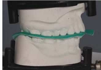
2. den Artikulator (gipslose Modellfixierung) fest schließen