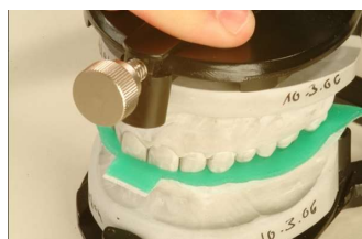
6. im Artikulator mehrmals in Zentrik führen, dann die Stopps lichthärten