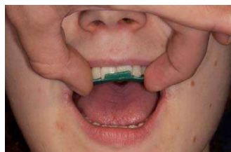
4. fertigen Registrat-Träger im Mund auf perfekten Sitz prüfen