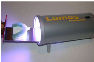
3. den so perfekt adaptierten Träger 3-6 Minuten lichthärten