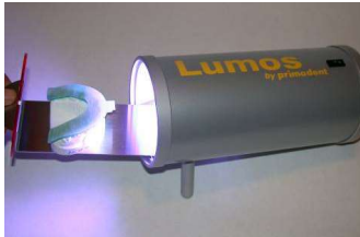
3. den so perfekt adaptierten Träger 3-6 Minuten lichthärten