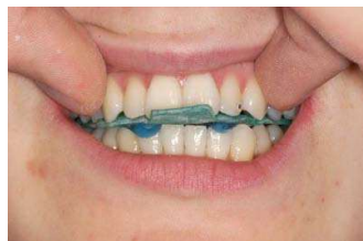
6. Patient mehrmals in Zentrik führen, dann die Stopps lichthärten