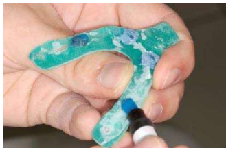
7. bei den posterioren Stopps gleichermaßen vorgehen