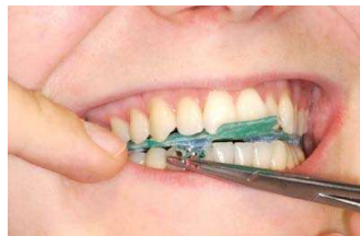
8. fertiges Registrat mit Shimstockfolie abschließend prüfen

Lichthärtende primobyte Registrat-Teile stellen durch ihre Beschaffenheit eine minimale Sperrung der Vertikalen bei der Bissregistrierung sicher, denn sie sind extrem dünn, dennoch hoch form- und dimensionsstabil. Sie sind fest und temperaturunempfindlich und bleiben lange erhalten, sodass in der Regel nur ein Registrat benötigt wird.