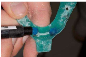
5. primobyte Detailpaste (lichthärtend) für anteriore Stopps auftragen