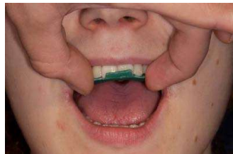
4. fertigen Registrat-Träger im Mund auf perfekten Sitz prüfen