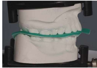
2. speedbyte Artikulator (gipslose Modellfixierung) fest schließen