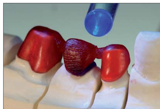
Abb. 15: Falls nötig, kann man jederzeit mit der UV-Handlampe kurz zwischengehärtet.