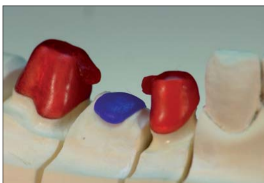
Abb. 12: Soll das Zwischenglied auch von basal verblendet werden, genügt ein Platzhalter aus Wachs.