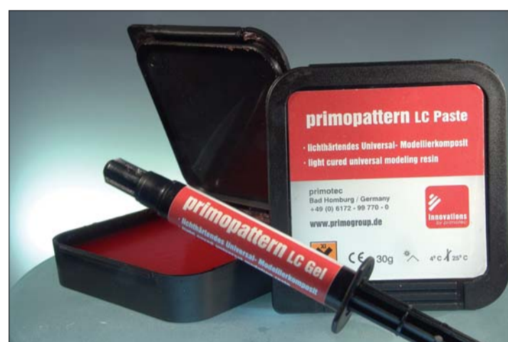
Abb. 1: Gebrauchsfertig als Gel oder Paste – das lichterhärtende primopattern LC Universalkomposit zum Modellieren.

ZT Joachim Mosch Tannenwaldallee 4 61348 Bad Homburg Tel.: 0 61 72/9 97 70-0 Fax: 0 61 72/9 97 70-99 E-Mail: mosch@primogroup.de www.primogroup.de