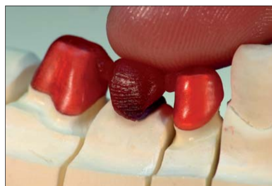
Abb. 13: Das aus Paste vorgeformte Pontic wird zwischen die Käppchen gesetzt.