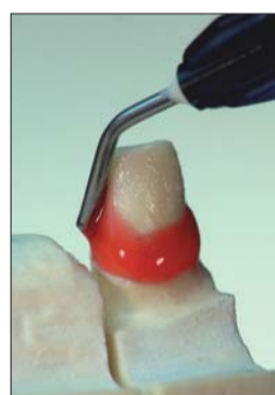
Abb. 5: Die Viskosität des Gels ist exakt eingestellt und gewährleistet schnelles und präzises Modellieren ...