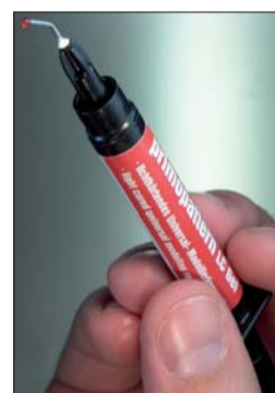
Abb. 4: Durch das Auftragen direkt aus der Spritze ist primopattern LC Gel besonders sparsam im Verbrauch.