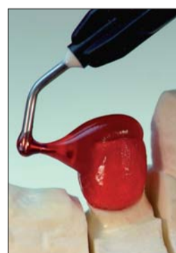
Abb. 9: Aufgrund seiner thixotropen Eigenschaften lässt sich das Gel ideal modellieren.