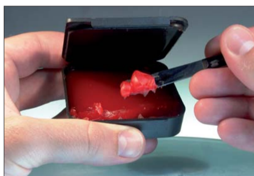
Abb. 10: Die geeignete Menge primopattern LC Paste lässt sich einfach mit einem Spatel aus der Verpackung entnehmen.