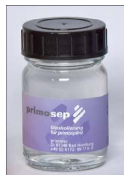
Abb. 2: Isoliert wird mit primosep, einer besonders hochwertigen Gips/Kunststoff-Isolierung.