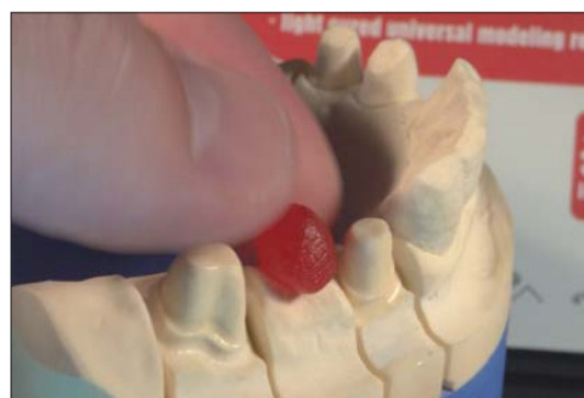
Abb. 11: Da die Paste weich ist und nicht klebt, kann man das Pontic leicht mit den Fingern vormodellieren.