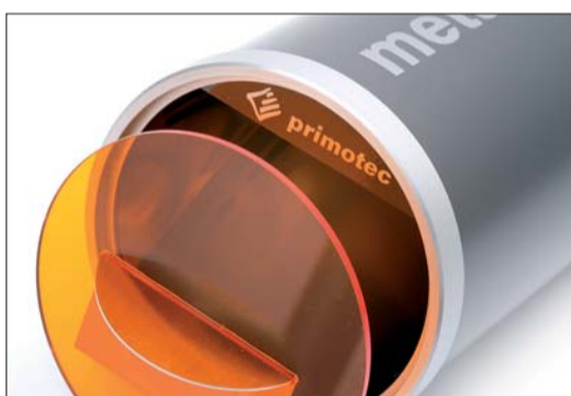
Abb. 7: primopattern ist bei der Lichthärtung absolut polymerisationsneutral und dimensionsstabil.