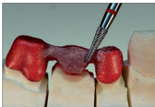
Abb. 18: Die Modellation kann direkt eingebettet werden, eine Wartezeit zum „Ausdampfen“ wie bei PMMA-Modellierkunststoffen ist nicht nötig.