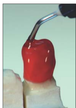
Abb. 6: ... bei gleichzeitig hoher „Standfestigkeit“, die dafür sorgt, dass das applizierte Gel nicht wegläuft.