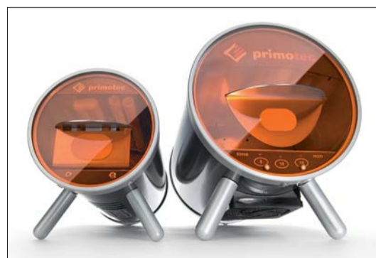
Abb. 17: primopattern LC weist keine klinisch relevante Polymerisations-schrumpfung auf, die Passung ist perfekt.