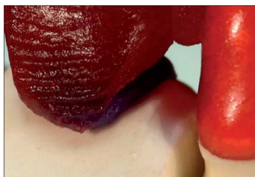
Abb. 14: Die primopattern Paste wirkt dunkelroter als das Gel, weil das blaue Wachs unter dem Pontic durchscheint.