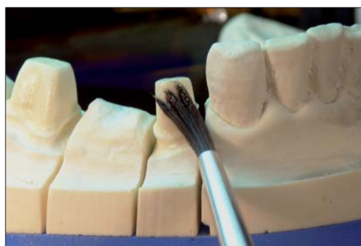
Abb. 3: Die primosep-Isolierung muss auf die feuchte Gipsoberfläche aufgetragen werden, damit sie die maximale Isolierwirkung entfalten kann.