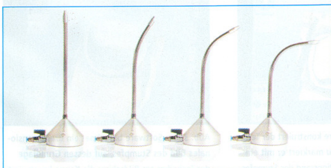
Der flexible Edelstahlmetallgelenkschlauch ermöglicht die genaue Ausrichtung des Luftdruckstrahls in alle Richtungen.

Ein angenehmer Einsatzzweck im Sommer ist die Verwendung als „Arbeitsplatzkühlung“: Da die Druckluftanlagen meist im Keller beziehungsweise an kühlen Orten aufgestellt sind, ist die Twister -Luft kühl und bringt einen größeren Effekt als die Verwendung eines (nur umwälzenden) Ventilators. Und wer einen kühlen Kopf bewahrt, arbeitet konzentrierter und ausdauernder. An dieser Stelle wurden nur einige, häufig im Laboralltag auftretende, Einsatzgebiete des Twisters aufgegriffen. Sicher gibt es noch weitere Verwendungsmöglichkeiten – der Phantasie der Anwender sind keine Grenzen gesetzt.