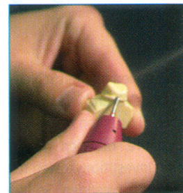
Stäube einfach wegpusten lassen: So bleibt die Sicht auf die Präparationslinie frei.

dünnt: eine weitere Senkung der gesundheitlichen Belastung des Technikers.