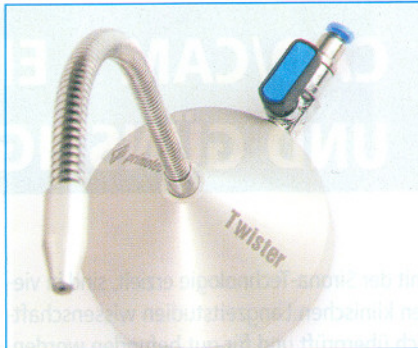
Der aus hochwertigen Materialien gefertigte Twister verfügt dank des CNC-gefrästen Aluminiumkegelfußes über einen sicheren Stand.

Beim Abtrennen der Gusskanäle entsteht neben dem Abrieb der Schleifscheibe und dem feinen Metallstaub auch noch enorme Reibungshitze, die das Halten der Arbeit mit der bloßen Hand nach kurzer Zeit unmöglich